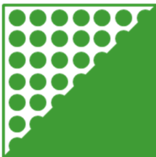
ORAFLEX® 11655 средняя